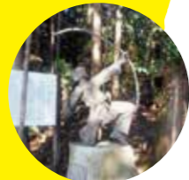
日本武尊ゆかりの鴨の宮