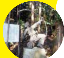
日本武尊ゆかりの鴨の宮