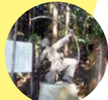
日本武尊ゆかりの鴨の宮